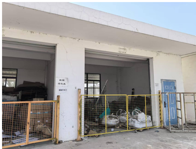
图 3-3 一般固废暂存间