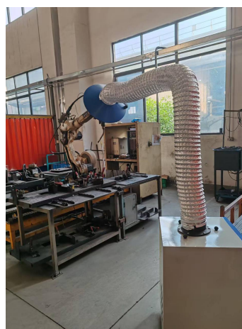
图 3-1 焊烟净化装置现场照片