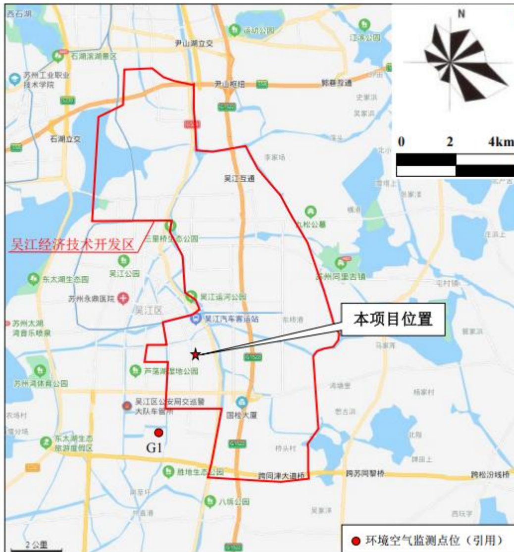
附图一：项目地理位置图