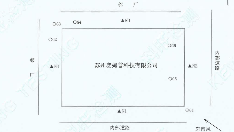
附件 1 点位示意图 2026.1.14